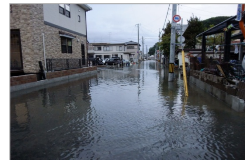
※冠水時の状況(上記は台風通過後) 浸水の深さは、5~15cm程度。